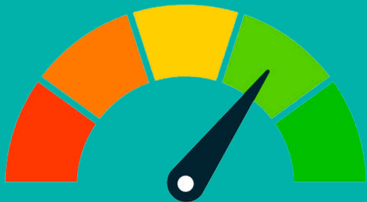
Bienestar Emocional y Mental